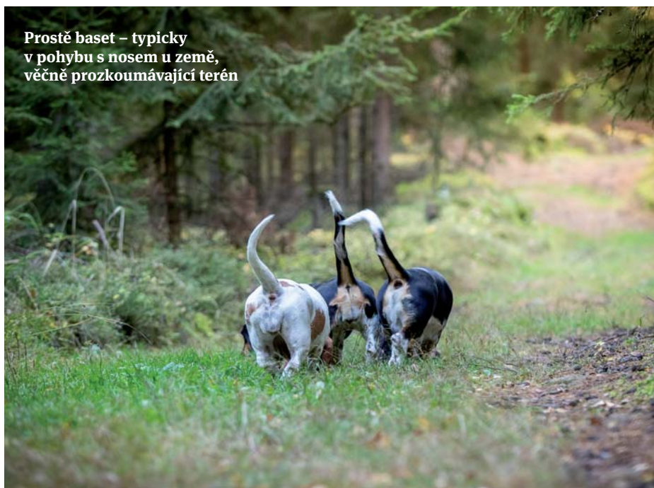
Prostě baset – typicky v pohybu s nosem u země, věčně prozkoumávající terén