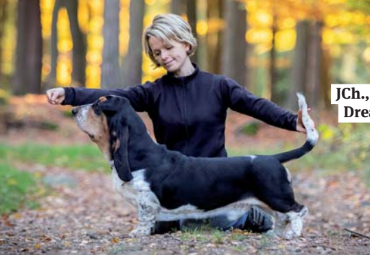
JCh., Evropský vítěz mladých 2019 Dream Chaser Bohemia Horrido