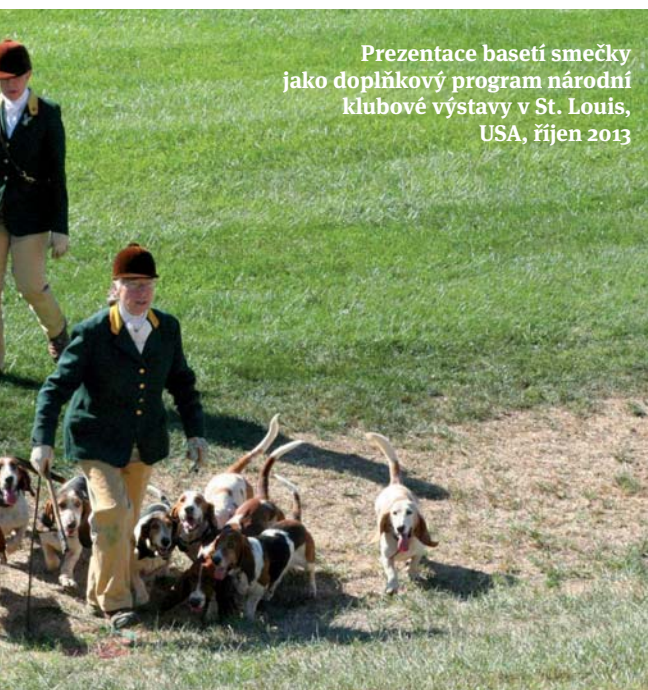
Prezentace basetů smečky jako doplňkový program národní klubové výstavy v St. Louis, USA, říjen 2013